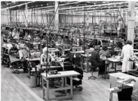
W aglomeracji łódzkiej przed 1989 r. wiele osób pracowało w dużych zakładach włókienniczych i odzieżowych.

Przez dziesiątki lat w konurbacji katowickiej powstawały przede wszystkim kopalnie węgla kamiennego, huty, elektrownie i zakłady produkujące konstrukcje stalowe czy sprzęt górniczy. W efekcie w 1988 roku udział przemysłu w strukturze zatrudnienia wynosił tam około 61%. Skutkiem restrukturyzacji przemysłu była likwidacja wielu nierentownych kopalni, hut oraz powiązanych z nimi zakładów. Obecnie w dawnych miejscach ich funkcjonowania powstają między innymi centra kulturalne i handlowe . Przykładem jest centrum handlowe wybudowane w Katowicach na terenie byłej kopalni Gottwald.