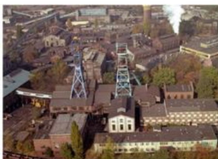
Przed 1989 r. bardzo ważną rolę w gospodarce aglomeracji katowickiej odgrywały górnictwo i hutnictwo.