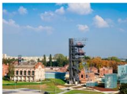
Po 1989 r. wiele zakładów przemysłowych zmieniło swoje funkcje. Stały się one na przykład muzeami.