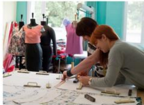
Po 1989 r. upadło wiele zakładów włókienniczych w Łodzi. W ich miejsce powstały jednak małe firmy projektujące i szyjące ubrania.

W drugiej połowie XX wieku przemysł rozwijał się intensywnie również w Łodzi. W tym czasie stała się ona największym centrum przemysłu włókienniczego i odzieżowego w Polsce. Pod koniec lat 80. XX wieku udział przemysłu w strukturze zatrudnienia przekraczał tam 50%. Po 1989 roku większość dużych zakładów przemysłowych zbankrutowała. Mimo to aglomerację łódzką wciąż uznaje się za stolicę polskiego włókiennictwa. Obecnie funkcjonuje tam wiele małych firm szyjących nie tylko ubrania, lecz także specjalistyczne wyroby dla medycyny, rolnictwa oraz przemysłu samochodowego.