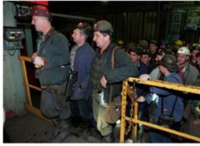
W latach 1989–2014 zatrudnienie w polskich kopalniach węgla kamiennego zmniejszyło się ponadczterokrotnie.