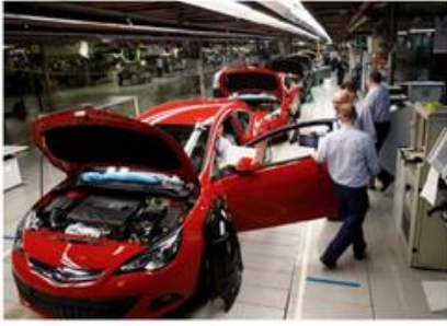
Miejsce tradycyjnego przemysłu ciężkiego w strukturze zatrudnienia na Śląsku zajmuje obecnie nowoczesny przemysł motoryzacyjny.